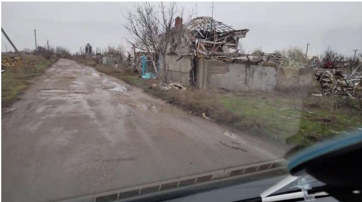
Confrontatie met de schade door het strijdgewoel nabij Mikolaev – provincie Kherson

Na deze confronterende rondgang keren ze terug naar de stad Kherson – stad in de frontlinie.