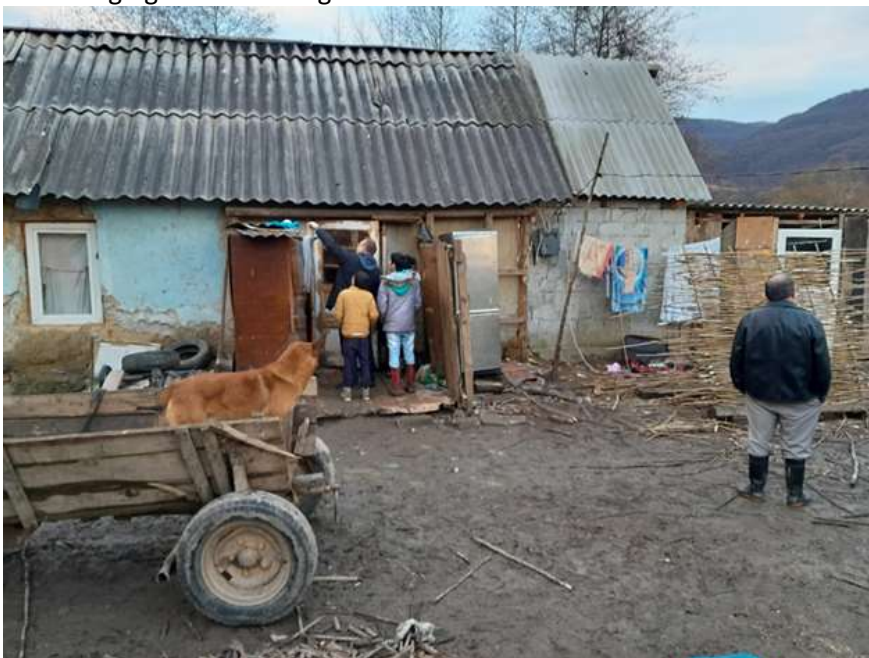
In dit “huis” wonen 14 mensen, 3 generaties samen... door vele regen alles nat, dak lekt en beek ernaast zo hoog dat water over vloer stroomt...

We danken de Heere voor Zijn bescherming en dat we zo iets mochten doen, praktisch en voor de verkondiging van het Evangelie. Een kleine lichtstraal in een land vol duisternis.