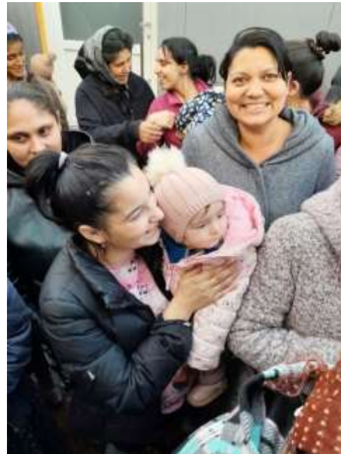
Moeders die eindelijk een goed maal én goede babyvoeding krijgen stralen nu.

Daarna bezochten we samen met de baron een paar huisjes, waar speciale noodsituaties waren, om te kijken hoe er later in 2024 concreet geholpen kan worden.