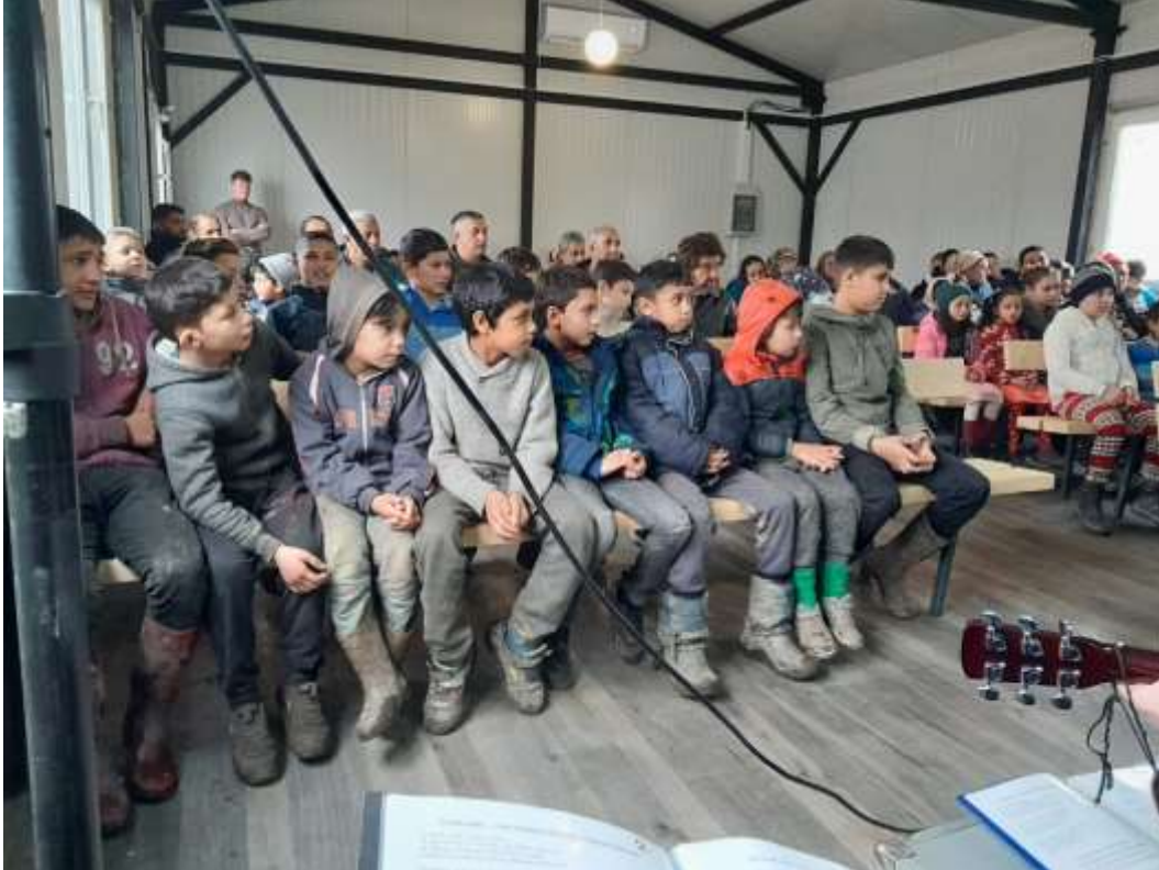
Roma's in Tyra Pasika – ze horen nu in deze tabor elke week Gods Woord

van hut tot hut op hun aanwijzing. 125 hutten en huisjes langs. Grote vreugde overal. Er wordt afgesloten met korte slotsamenkomst. Het was een intensieve, maar voor iedereen blijde dag.