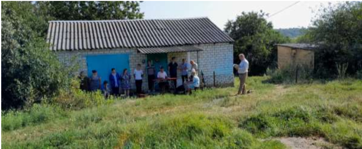
Tisjinovka – dicht bij de frontlinie, in de brandende zon, klinkt het Evangelie